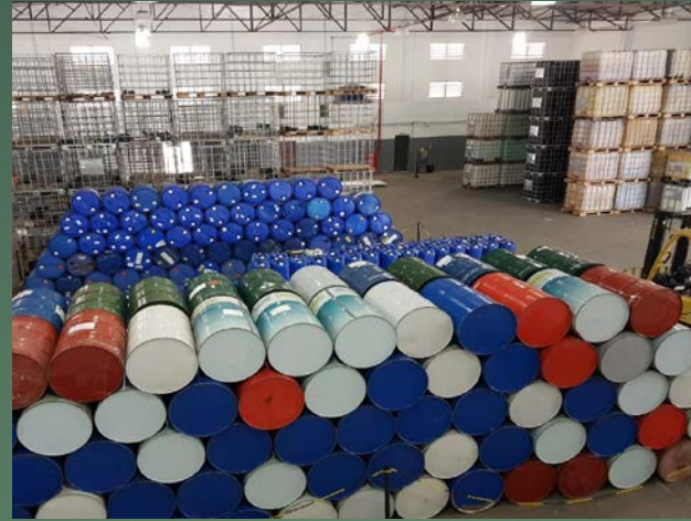
Setor de Estoque