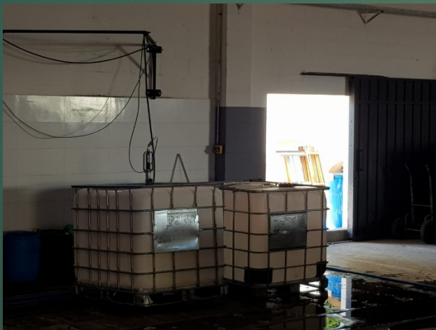
Setor da Higienização