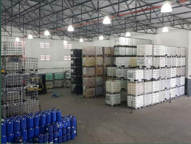
Setor de Estoque