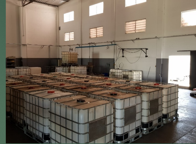
Setor da Higienização