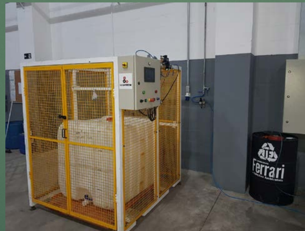
Teste de Estanqueidade