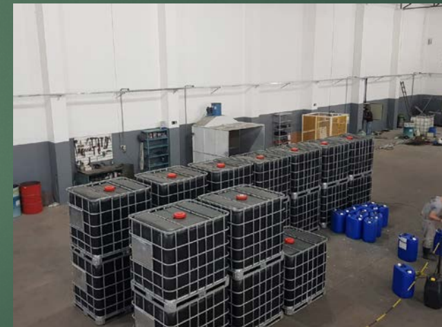
Setor de Solda e Pintura